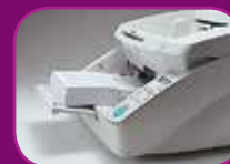
Unterste Position (500 Blatt)