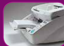
Mittlere Position (300 Blatt)