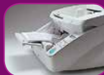
Höchste Position (100 Blatt)

Der automatische Dokumenteneinzug bietet drei Zufuhrmodi (100, 300 und 500 Blatt), die je nach Auftragsumfang angepasst werden können und so Zeit sparen und den Durchsatz steigern.